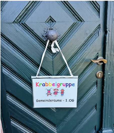
... hier geht's zur Krabbelgruppe.

Es ist 09:30 Uhr und ich checke noch mal alles, Baby hat gegessen, getrunken und die Windel tut es auch noch. So langsam mache ich mich und meinen Sohn also fertig für die Krabbelgruppe.