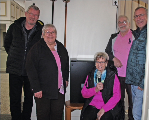
Der Vorstand vor der neuen Anlage