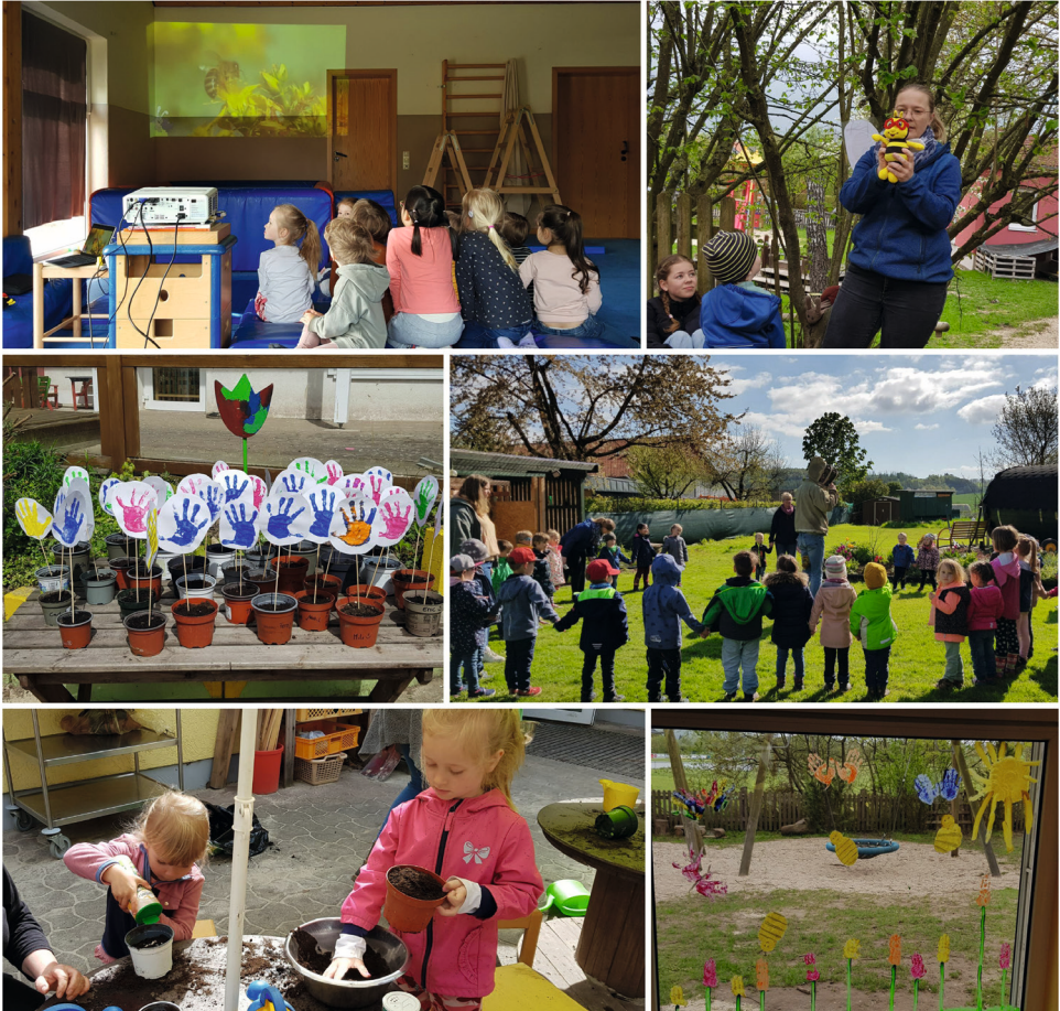
Collage der Naturwoche