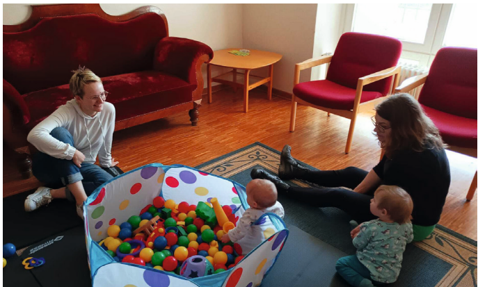
Immer wieder gerne: das Bad im Bällebad

Eine lustige Runde ist es, die Babys und Kleinkinder sind zwischen drei Monaten und 1 ½ Jahren alt. Ein schöner Trubel, wenn die Kleinen fröhlich glucksend nach den Spielsachen greifen oder sich kopfüber in das Bällebad stürzen. Ab und an traue ich mich auch, ein Lied anzustimmen, selten singe ich alleine,