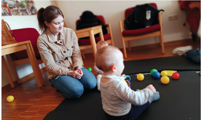
In der Krabbelgruppe treffen sich derzeit Kleinkinder zwischen 3 Monaten und 1 1/2 Jahren.

Trotz des kleinen Trubels kommt das Erzählen nicht zu kurz. Probleme mit dem Schlafen, dem Essen oder Zähnchen? Wissend nicken sich die Eltern zu. So manches ist mir auch nur allzu bekannt und es lässt sich die eine oder andere Anekdote hören. Genau das ist es, was ich mir erhofft habe von dieser neuen Krabbelgruppe, fröhlicher Austausch und eine Runde, die sich wie zuhause anfühlt. Denn das soll die Kirche ja nun auch für alle Menschen sein. Ein Zu-