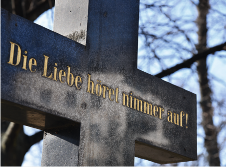
Aus 1. Korinther 13,8

So spricht der Herr: Fürchte dich nicht, denn ich habe dich erlöst; ich habe dich bei deinem Namen gerufen; du bist mein! (Jesaja 43,1)