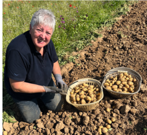
Schweißtreibende Arbeit auf dem Feld

während des Ernte Vorganges werden hier die Kartoffeln von 3 Personen direkt vorsortiert und kontrolliert.