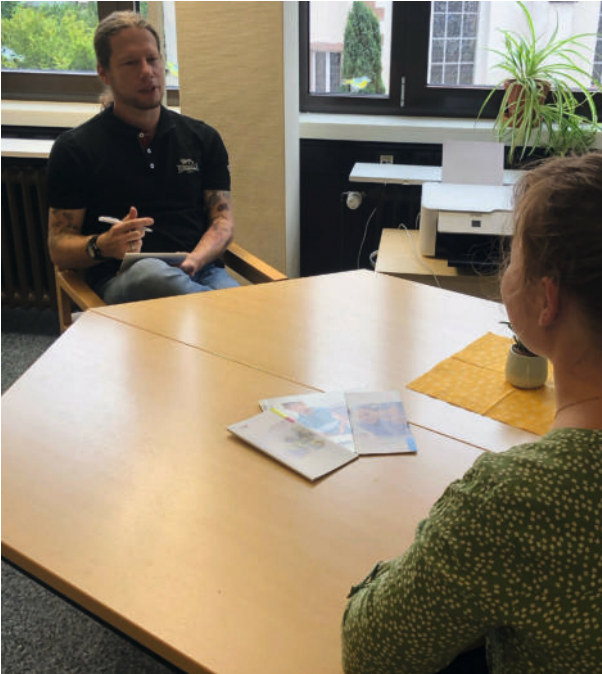
Darstellung einer Beratungssituation

Allgemein beziehen wir uns auf Themen rund um legale und illegale Suchtmittel, wie auch auf verhaltensbezogene Süchte wie digitale Medien und Glücksspiel.