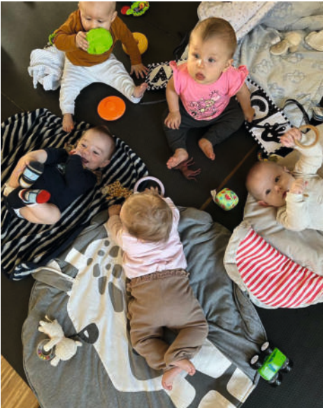
Fröhlicher Klein(st)kinder-Treff

„Hallo, wer bist du? Du bist ja wie ich!“