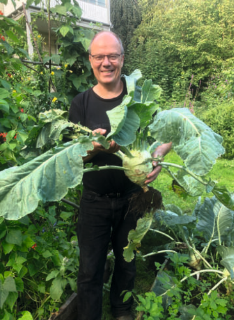
Reiche Ernte beim Pastor

Vieles ist wieder wunderbar gewachsen in unseren Gärten und auf unseren Feldern. Wir können dankbar sein für die Ernte, dankbar dafür, dass wir haben, was wir zum Leben brauchen. Und wir sollten danken all denen, die jeden Tag dafür arbeiten, dass wir all das haben.