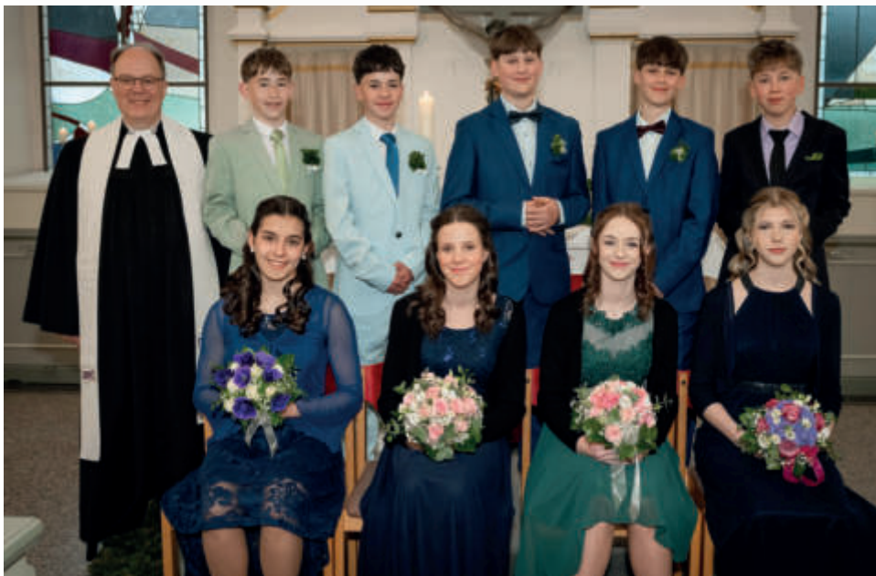
Konfirmanden von St. Georg