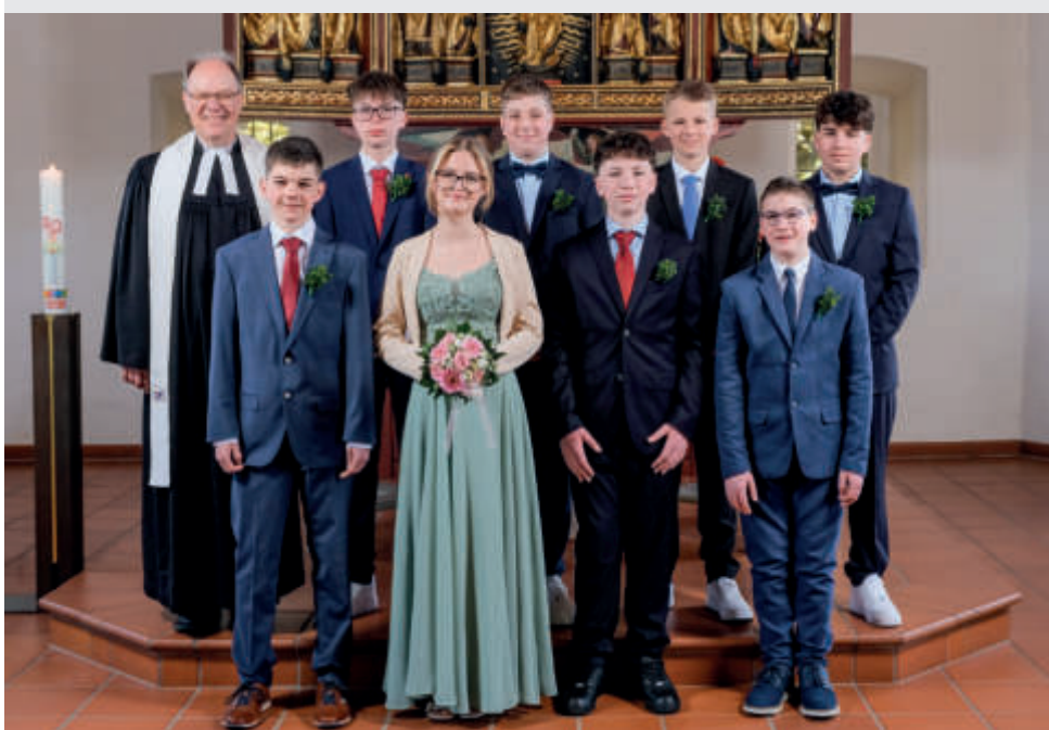
Konfirmanden von St. Martin 2026