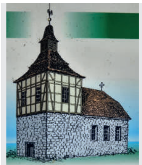
Marienkapelle Förste (vermutliches Aussehen)

Dieser Ort trägt eine lange und bewegte Geschichte in sich: Hier stand einst die St. Martins- und Marienkapelle zu Förste. Sie wurde im Jahr 1304 von der Familie von Letgast gestiftet. Nach dem Aussterben der Stifterfamilie gingen die Rechte auf die Familie von Oldershausen über. Über Jahrhunderte hinweg war diese Kapelle ein geistlicher Mittelpunkt des Ortes.