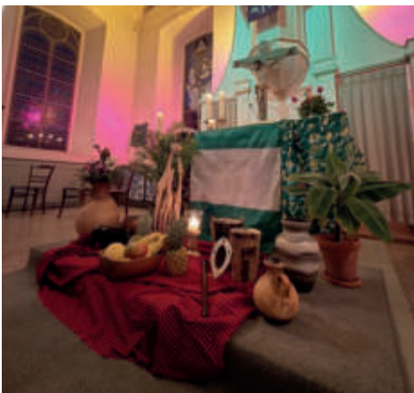
Der geschmückte Altar 2026