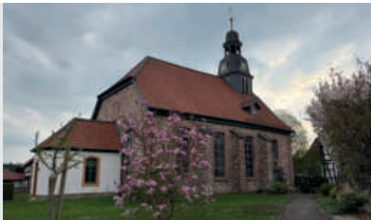
Kirche St. Georg in Eisdorf