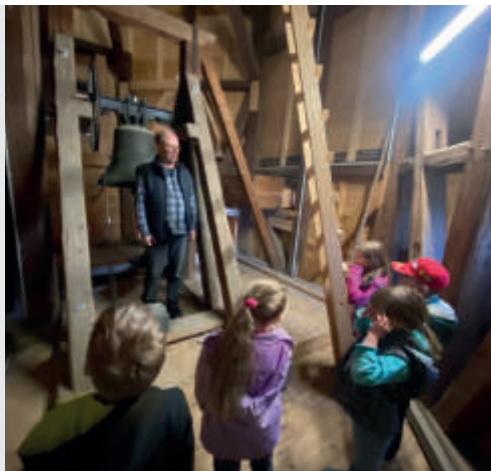
Im Glockenturm

Am 11. April 2026 fand unser Kinder-gottesdienst statt, zu dem wieder viele KiGo-Kinder der Einladung gefolgt sind. Die Freude über das Wiedersehen war groß, und gleich zu Beginn wurde deutlich: Dieser Vormittag würde etwas ganz Besonderes werden. Unter dem Motto „Wir entdecken unsere Kirche“ machten sich die Kinder gemeinsam auf eine spannende Reise.