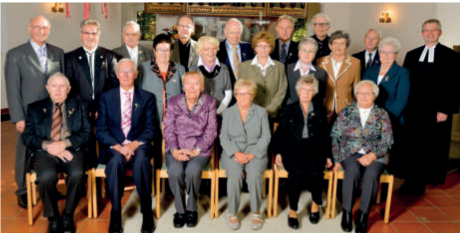
Nienstedt: Diamantene Konfirmation 2012 - Konfirmationsjahrgang 1951

Die Jubilare werden im Sommer 2026 persönlich durch die Ortskirchengemeinden Eisdorf und Nienstedt angeschrieben und zu den Feiern eingeladen.